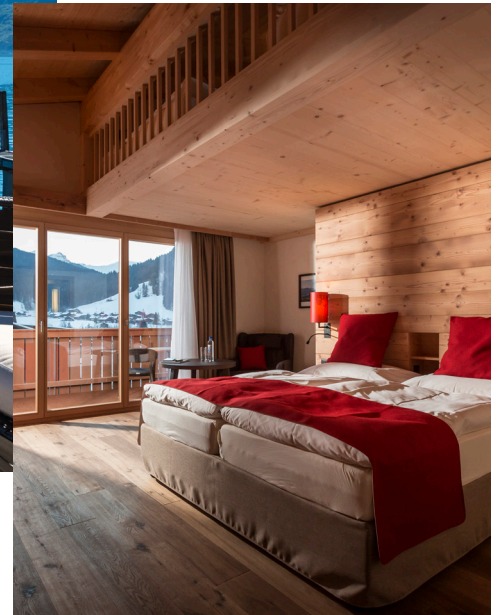
Grosszügig ausgestattete Zimmer, z.B. im Hotel Spitzhorn, Saanen | Gstaad